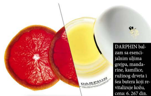
DARPIN balzam sa esencijalnim uljima grejpa, mandarine, kamilice, ružinog drveta i šea butera koji revitalizuje kožu, cena: 6.267 din.

ETERIČNO ULJE GREJPFRTA dobija se ceđenjem kore ploda i ima svež citrusni miris. U aromaterapiji eterično ulje grejpfruta se koristi pre svega zbog svog antidepresivnog i tonizirajućeg dejstva. Ublažava bolove, naročito u slučajevima migrena nervnog porekla. Sok ovog ploda blagotvorno utiče na razbijanje celulita čak i kroz brojne kozmetičke preparate.