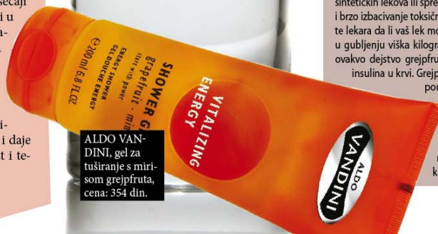
ALDO VANDINI, gel za tuširanje s mirisom grejpfruta, cena: 354 din.