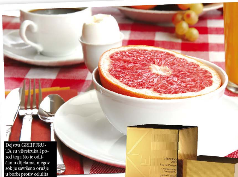
Dejstva GREJPFRTA su višestruka i pored toga što je odličan u dijetama, njegov sok je savršeno oružje u borbi protiv celulita

Samo polovina GREJPFRTA obezbeđuje dnevne potrebe za vitaminom C, dobar je izvor biljnih vlakana i vitamina A. Njegov osvežavajući i sočan plod stvara osećaj sitosti, a zauzvrat ima vrlo malo kalorija. Ipak, grejp sadrži velike količine flavonoida naringina, što može dovesti do problema i mnogih propratnih efekata nekih sintetičkih lekova ili sprečiti normalan metabolizam leka i brzo izbacivanje toksičnih delova. Obavezno konsultujte lekara da li vaš lek može da ide uz grejpfrut. Pomaže u gubljenju viška kilograma, a naučnici smatraju da je ovakvo dejstvo grejpfruta vezano za snižavanje nivoa insulina u krvi. Grejpfrut, pogotovo crveni, može da pomogne u snižavanju holesterola.