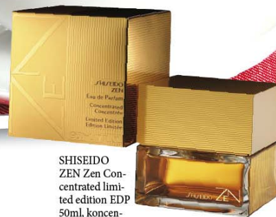
SHISEIDO ZEN Zen Concentrated limited edition EDP 50ml, koncentrovani parfem s mirisom grejpa, cena: 9.040 din.

DIJETA uz pomoć grejpa nije mit. Istraživači su pronašli da ljudi koji jedu pola grejpfruta uz svaki odbrok u roku od tri meseca u proseku smršaju dva kilograma.